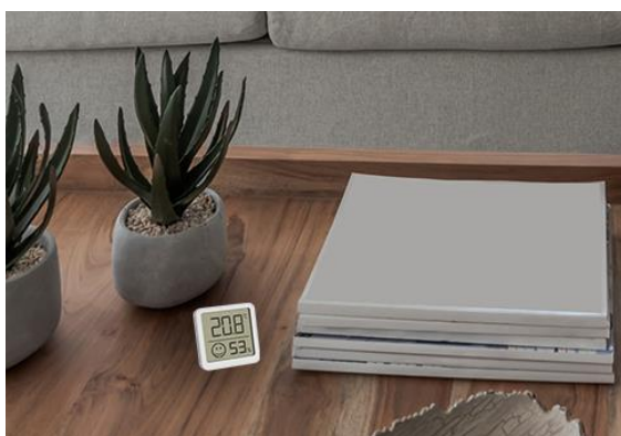
Mini-Thermo-Hygrometer, Artikelnr. 30.5053.02 von TFA Dostmann

Damit können Temperatur und Luftfeuchtigkeit am Aufstellort, in zwei weiteren Räumen und im Außenbereich gleichzeitig überwacht werden. So lässt sich gut einschätzen, wann und wo die Temperatur oder Luftfeuchtigkeit durch Regulierung der Heizung oder lüften angepasst werden sollte.