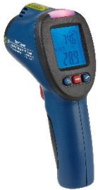
Infrarot-Thermometer mit Taupunktermittlung SCHIMMELDETEKTOR 31.1141 von TFA Dostmann

Neben dem Aufspüren von Wärmebrücken kontrolliert das Gerät gleichzeitig die Umgebungstemperatur und die relative Luftfeuchtigkeit. Daraus wird der Taupunkt errechnet. Je näher die Oberflächentemperatur an der Taupunkttemperatur liegt, desto höher ist die Gefahr von Schimmelbildung auf der gemessenen Oberfläche.