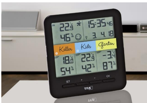
Digitales Thermo-Hygrometer Klima@Home, Artikelnr. 30.3060.IT, misst Temperatur und Luftfeuchtigkeit in 3 Räumen

Um wirklich effizient Heizenergie zu sparen, empfehlen wir, die Temperatur und am besten auch gleich die Luftfeuchtigkeit in jedem Raum individuell zu überwachen. Die Raumtemperatur sollte, je nach Nutzung, im unteren Komfortbereich gehalten werden. Um gleich mehrere Räume zu überwachen, eignen sich Funk-Thermometer, die mit kabellosen Temperatursensoren verbunden werden können. So lässt sich vom Wohnzimmer aus prüfen, wie viel Grad Celsius die Temperatur in anderen Räumen beträgt.